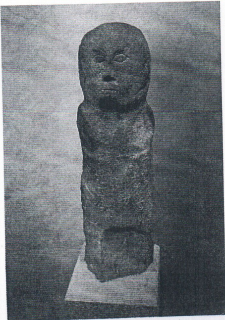
Çöyr Yazıtı/Balbalı, Moğolistan Millî Müzesi.

Tarihsel bilgilerimize göre Göktürk devleti 744 yılında Uygurlar tarafından yıkılmıştır. Uygur-