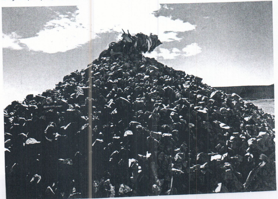
Karakorum yolunda bir "ovo".