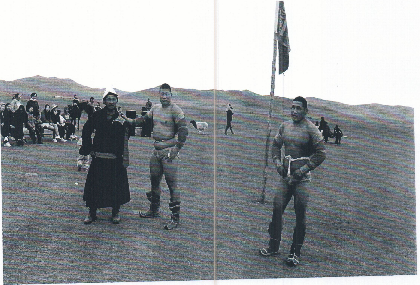
Moğolistan steplerinde bir güreş müsabakası.

da başarılı olamamışlardır. Ancak, Göktürk Yazıtları'ndan öğrendiğimiz üzere, İltiş Kağan 682'de 17 yakın adamıyla ayaklanmış, bunların kahramanlıklarını duyan kişilerin katılımıyla 70'i bulan küçücük bir orduyla başlayan özgürlük hareketi "Türklerin yok olmasını istemeyen, bir kavim olmasını isteyen Göğün/