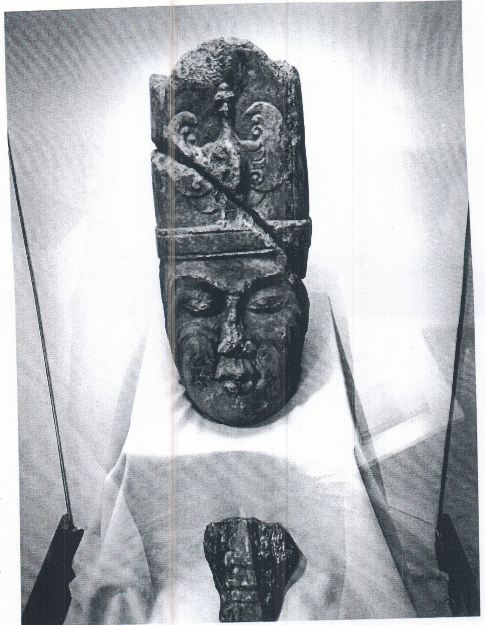
Kül Tegin'in heykel başı, Moğolistan Milli Müzesi.